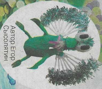
Автор Егор Сысолитин