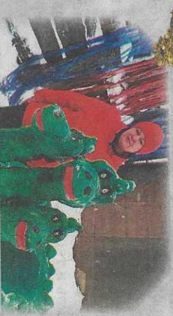
Змей Горыныч семьи Черемисных