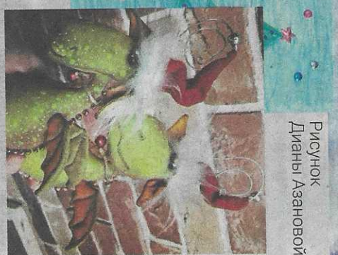
Рисунок Дианы Азановой