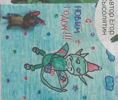
Рисунок Алексея Киселёва, 6 лет